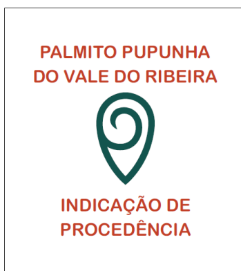
Figura 3: Signo distintivo (selo) da Indicação de Procedência Palmito Pupunha do Vale do Ribeira.